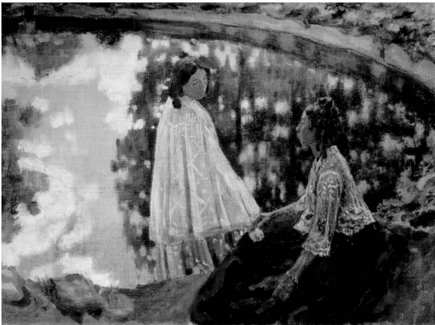
V.E. Borisov-Musatov. Singlim bilan avtoportret. 1898. Xolst, tempera, moybo'yoq. Rus davlat muzeyi, Sankt-Peterburg.

O'rta asrlarda yashab ijod qilgan nemis rassomlarining temperada ishlangan rangtasvirlarida asosan oq grunt qo'llanilganligini ko'rish mumkin. Ularning asarlarida